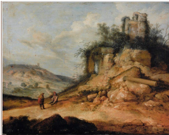
Macadan, landschap met twee reizigers en ruïne.

Macadan's werk komt sterk overeen met de landschappen van de Italiaanse Salvatore Rosa (1615-1673).