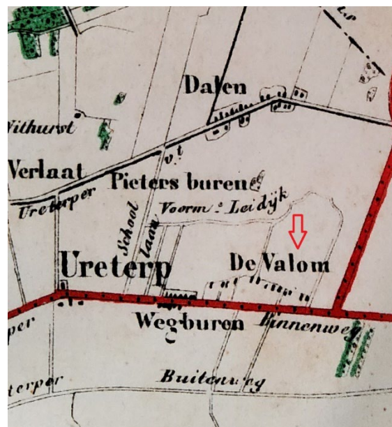
Kaart 1887 met de valom.

Kortom: Mancadan was meestal op het Voorwerk aanwezig en de valom was dichtbij. Hij kon er als het ware heen lopen.