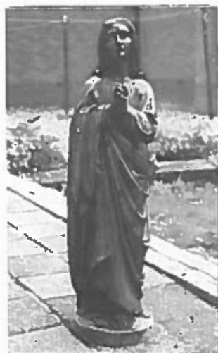
Mariabeeld uit de kapel op het kerkhof.

toegang. Bij de bouw van de nieuwe kerk in 1938 kwam een dubbele deur vrij. Deze deur werd verplaatst naar de voorgevel van de kapel. De toegang tot de grafkelder bevond zich oorspronkelijk onder een grafsteen gelegen op een verhoogd voetstuk voor de kapel. Door verzakking van de voorgevel van de kapel is deze toegang afgesloten, zodat de kelder alleen bereikbaar is door het gewelf onder de kapel-vloer open te maken.